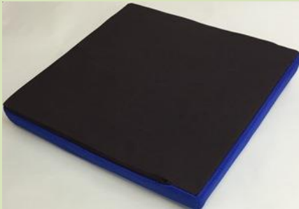
裏面滑り止め仕様