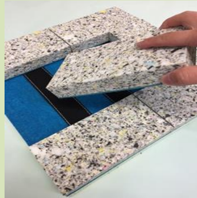
自由な場所に着脱配置可能

姿勢が傾く方、足こぎをする方、 前滑りを防ぎたい方、 ひざ裏の圧迫を軽減したい方に。 姿勢保持を簡易的にサポートするものであって、 体を完全に固定できるものではありません。