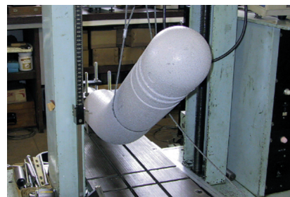
(財)日本車輻検査協会 東京検査所における強度試験

■ ボーロード強度試験 (財団法人・日本車輻検査協会による試験結果) (試験試料) ゴムチップ製ボーロード (型式 ST-10) (試験方法) 試料を固定し、上部ゴム部の中央に横方向の荷重を加え、たわみ角度と荷重を測定すると同時に、試験後の試料の状況を確認する。 (試験結果) たわみ角度35度・荷重3,000Nにて、き裂・破損等の異常を認めず。